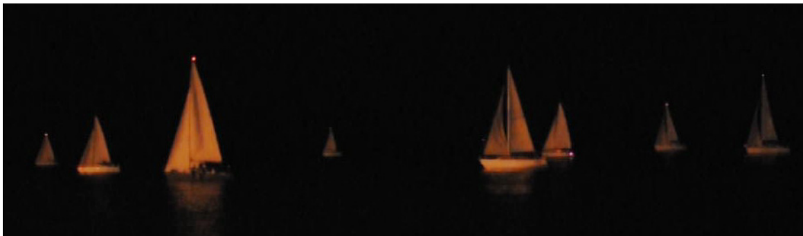
Largada de la regata nocturna

El sábado 27 de Octubre tuvo lugar una muy interesante y tradicional regata que se largó a las 21 horas y llevó a la flota de 14 barcos en navegación nocturna hasta el refugio del Tres Brazas donde pernoctó. La noche acompañó para que un hermoso espectáculo se brindara a quienes estaban presentes en la largada, donde la luz del muelle multiprósito se reflejaba en las velas y cascos de las embarcaciones participantes.